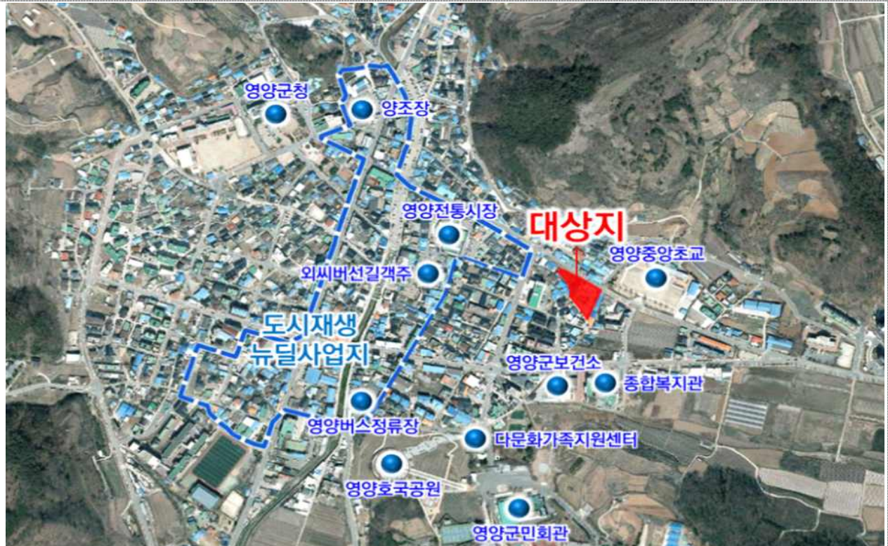
< 영양읍 서부리 1-3번지 일원 >