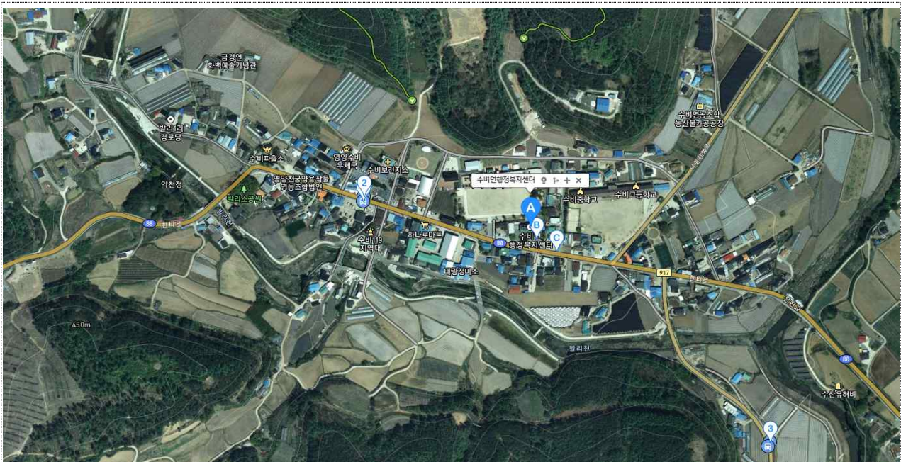
< 수비면 발리1, 2리 일원 >