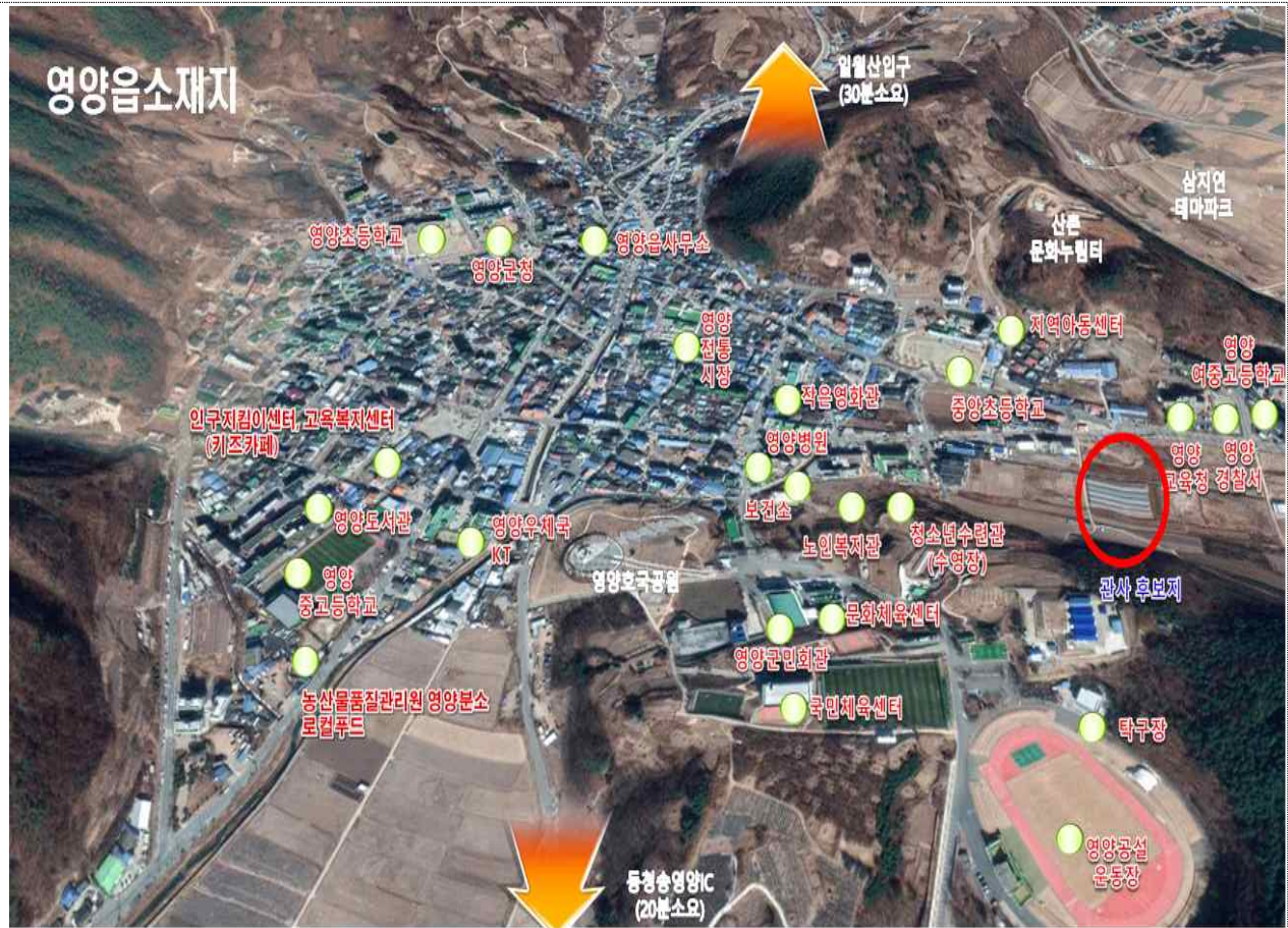
< 영양읍 동부리 140번지 일원 >