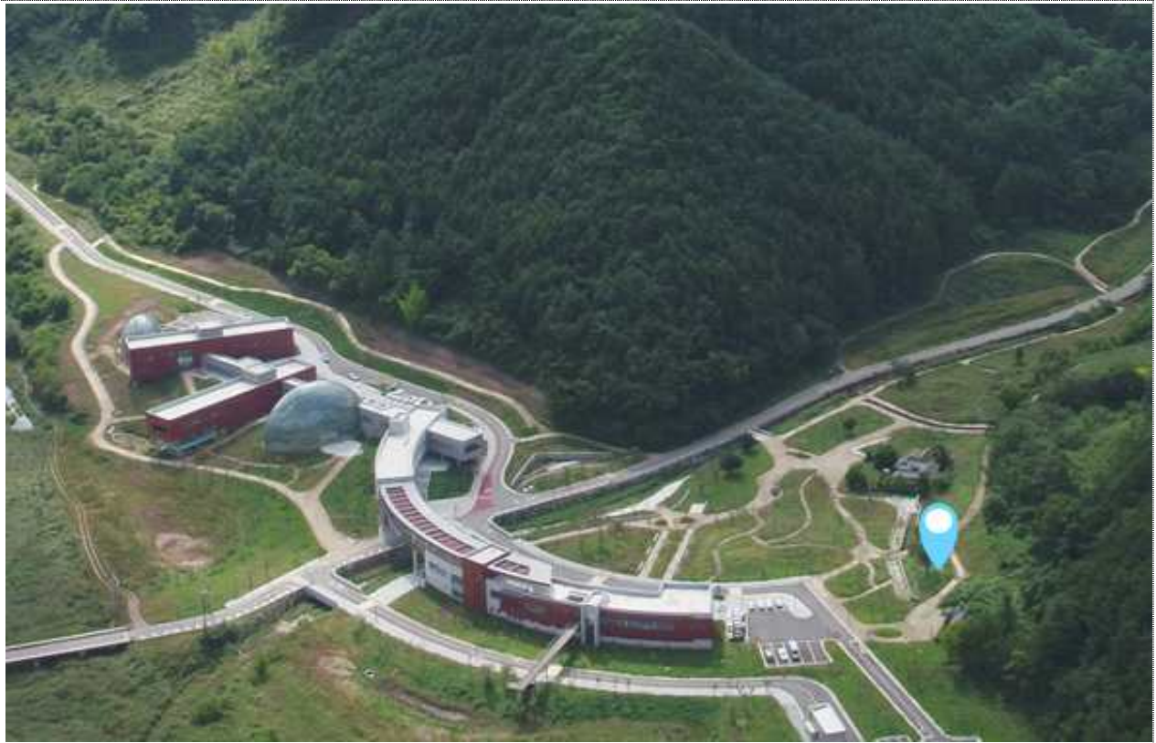
< 영양군 영양읍 대천리 일원 >