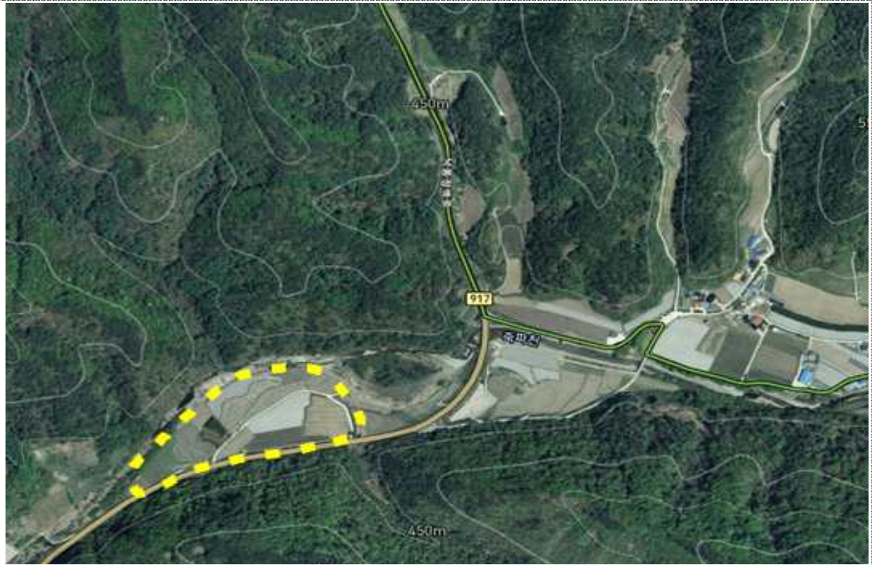
< 수비면 죽파리 375번지 일원 >