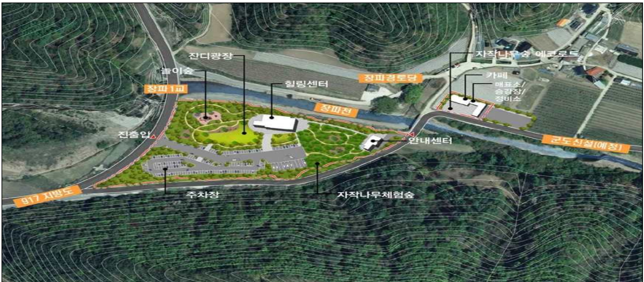
<수비면 죽파리 415번지 일원>