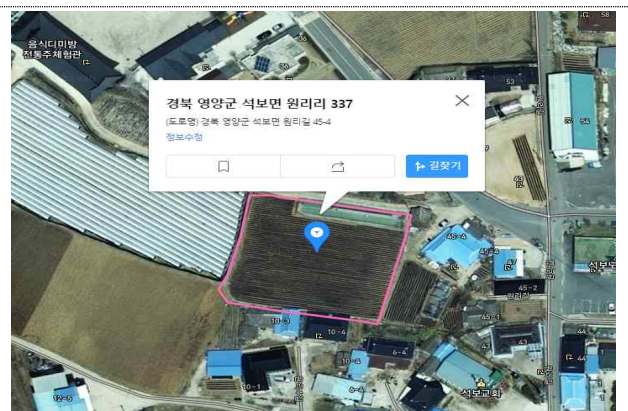
< 석보면 원리리 337번지 일원 >