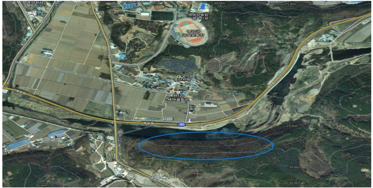
< 영양읍 현리 산16번지 일원 >