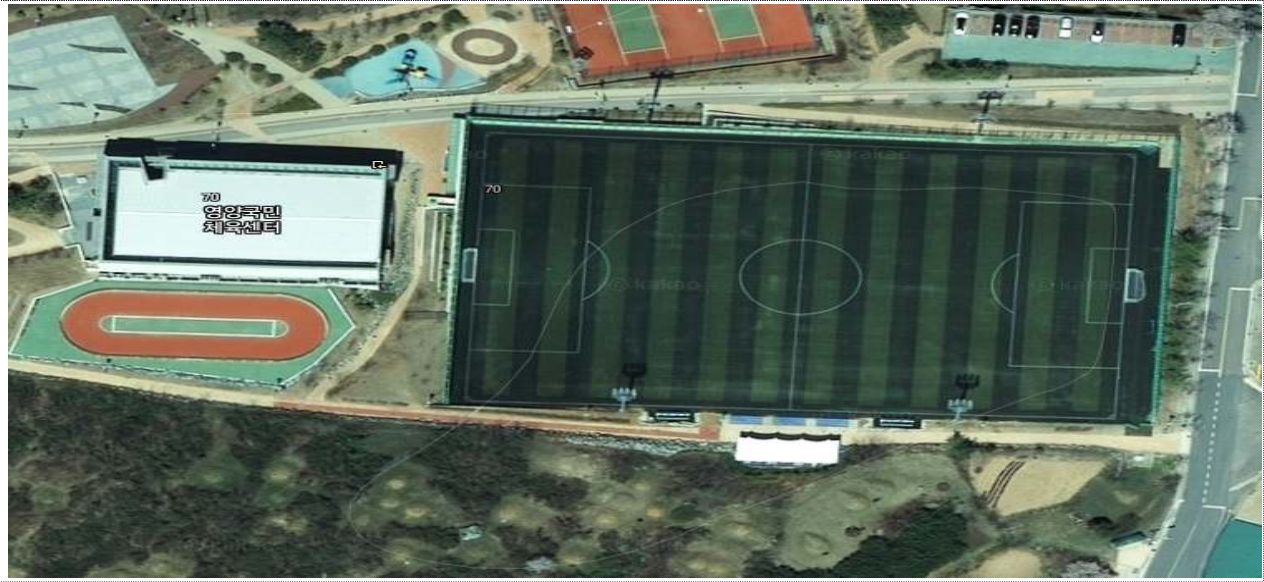
< 영양읍 서부리 136-3번지 일원 >