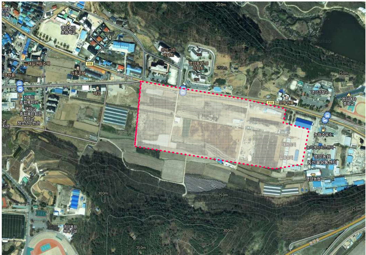
< 영양읍 동부리 일원 >