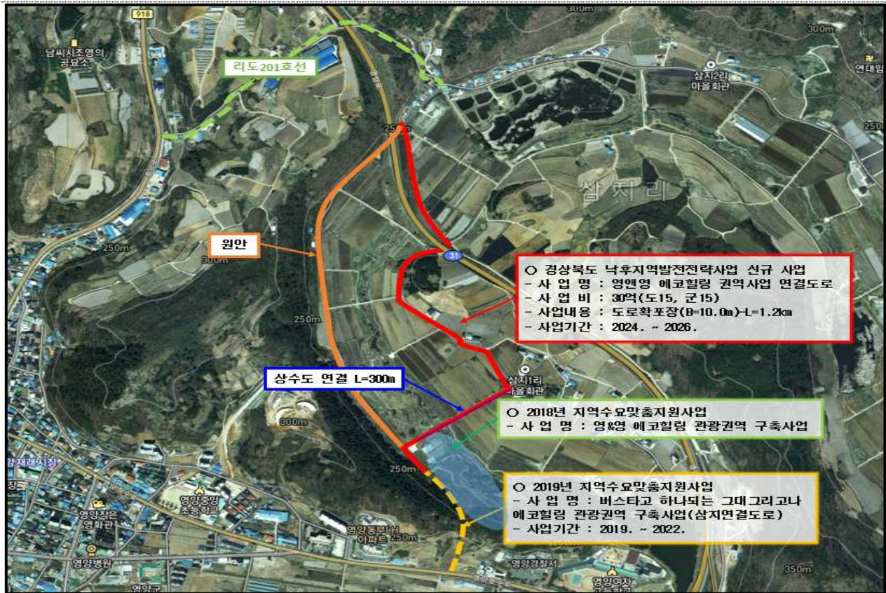
< 영양읍 삼지리 367-121번지 일원 >