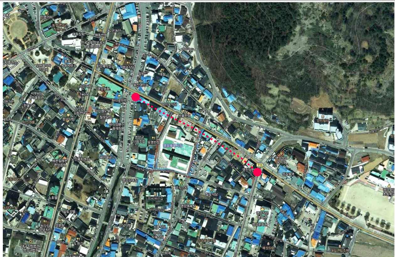
< 영양읍 서부리 319-6 ~ 동부리 190-30번지 일원 >