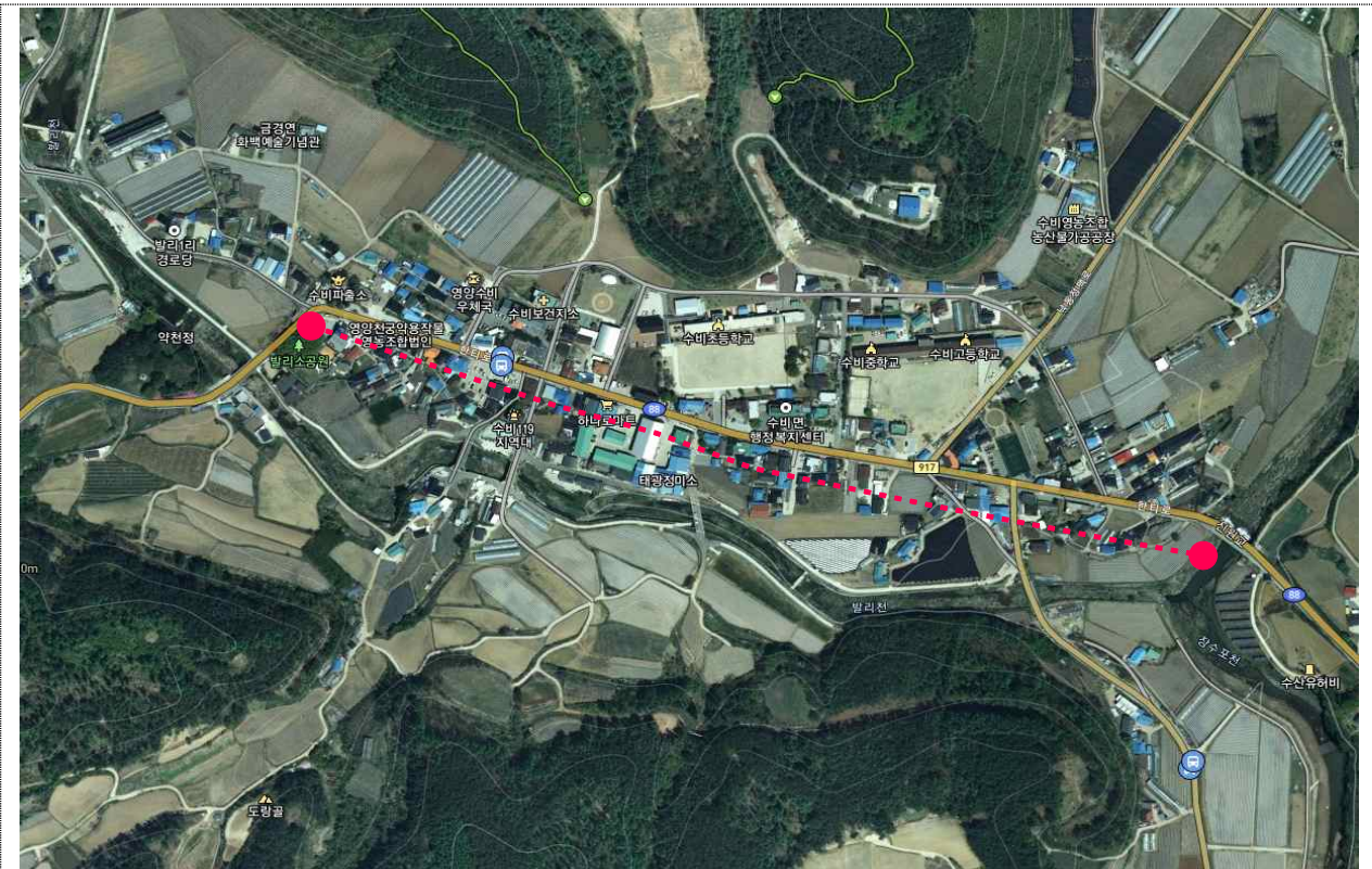
< 수비면 발리리 784-1 ~ 447-1번지 일원 >