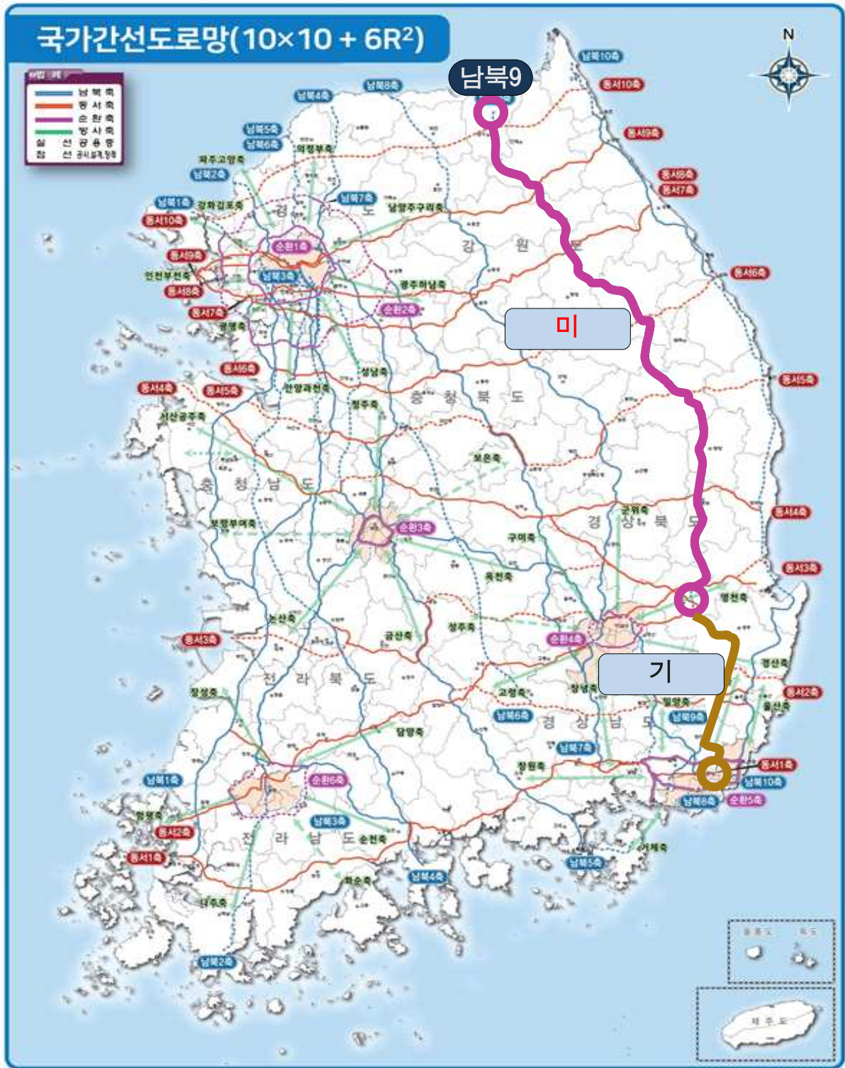
<제2차 고속도로 건설계획(안)>