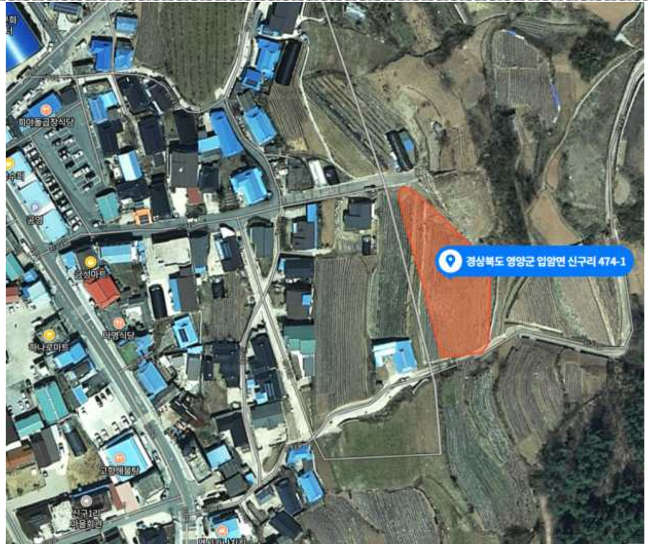
< 입암면 신구리 474-1번지 일원 >