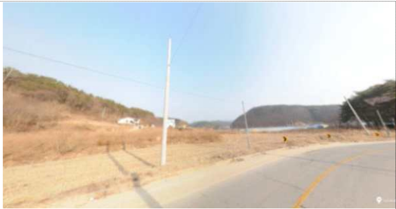
< 수비면 발리리 622번지 일원 >