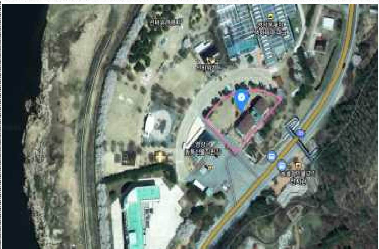
<영양군 선바위관광지 일원>