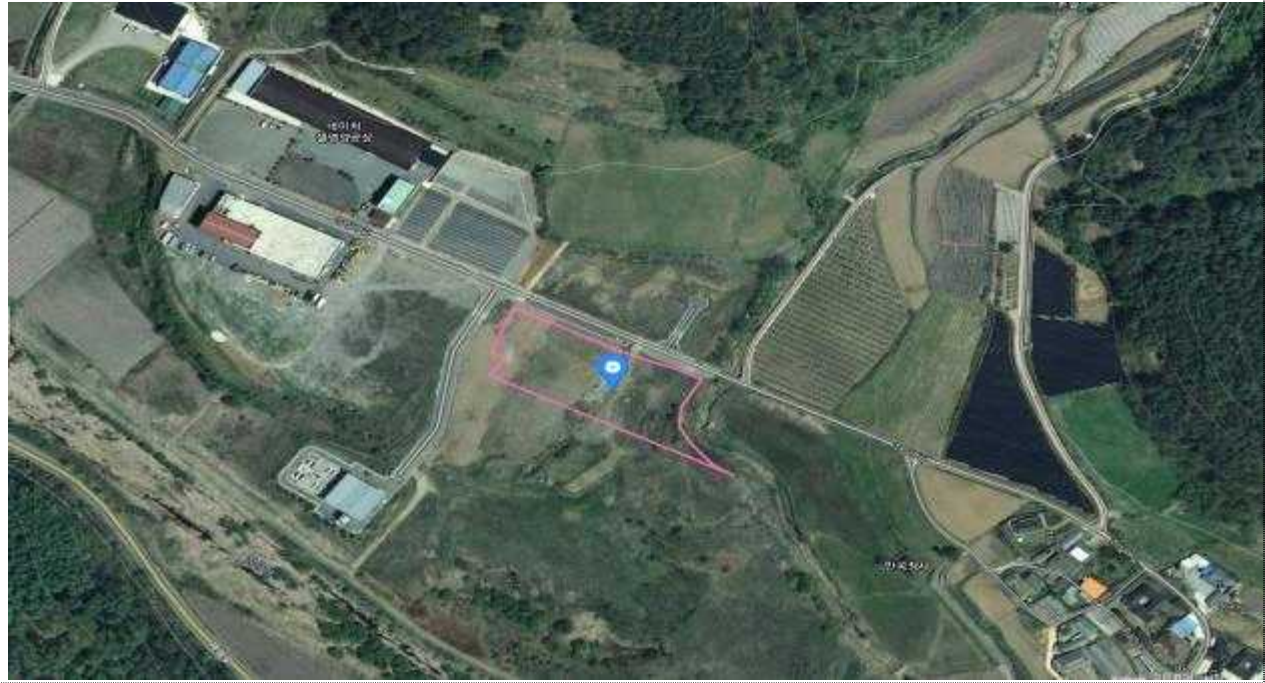
< 일월면 주곡리 168번지 일원 >