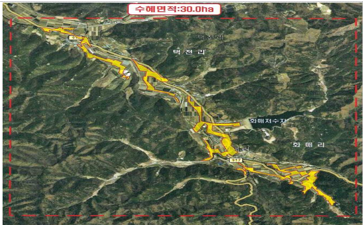
< 석보면 화매리, 택전리 일원 >