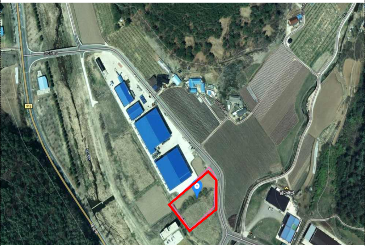
< 일월면 가곡리 315-10번지 일원 >