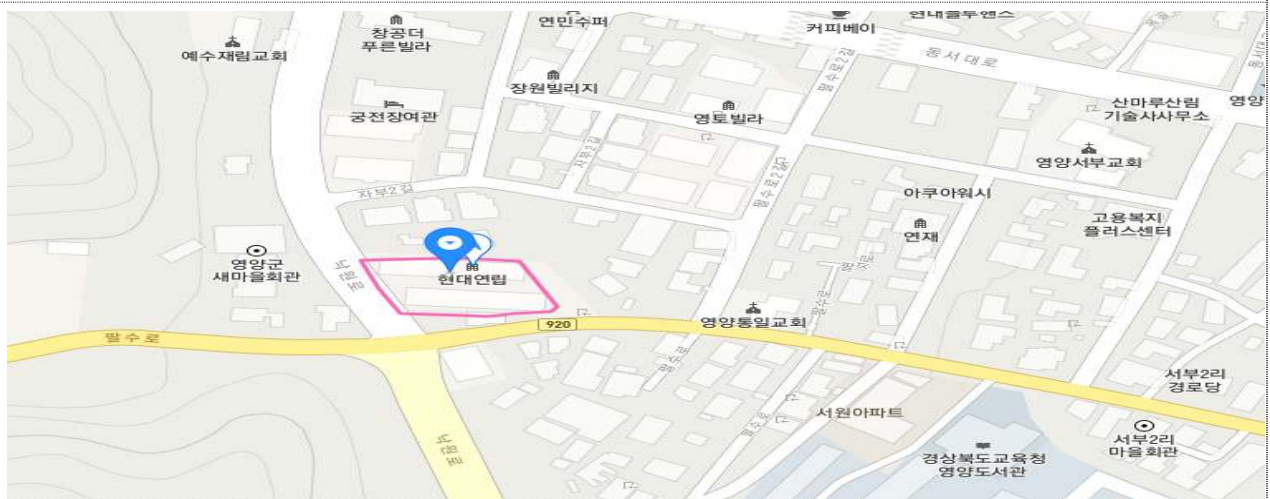
< 영양읍 서부리 509-1 일원 >