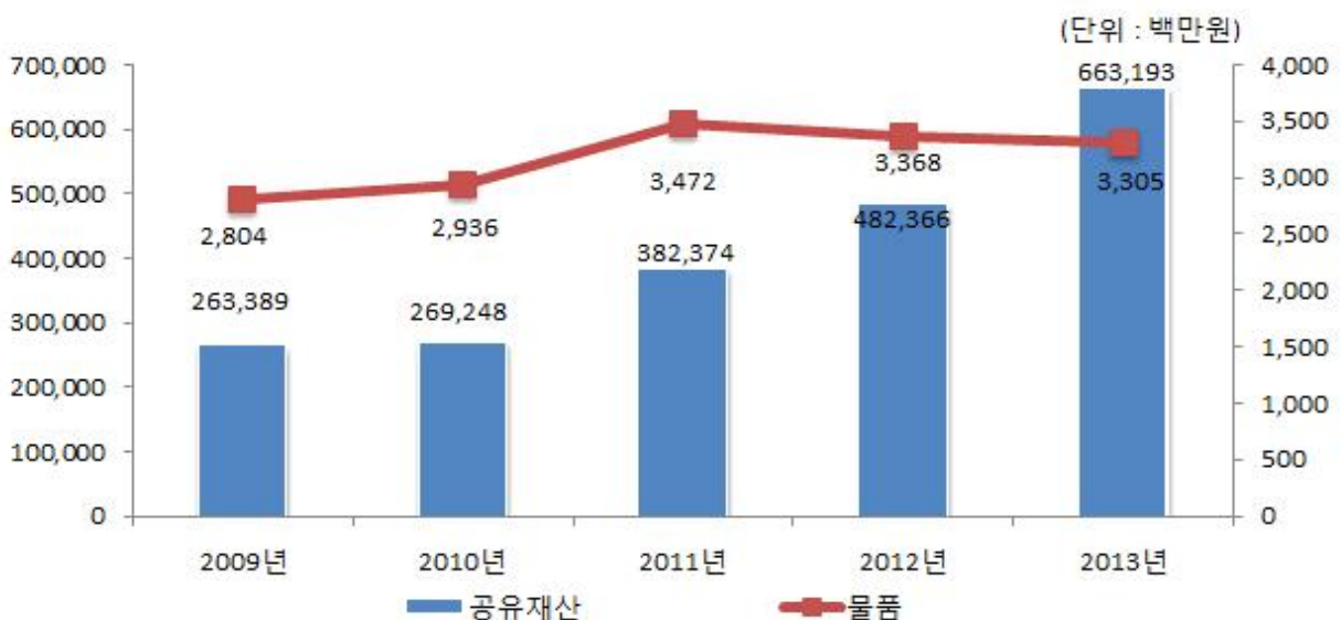
공유재산 및 물품의 연도별 변화